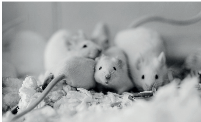
Jo-Anne McArthur / NEAVS / We Animals

L'expérimentation animale, telle qu'elle fonctionne aujourd'hui, n'existe que parce que le spécisme existe. Or, le spécisme doit cesser. L'expérimentation animale, dans sa forme actuelle, aussi.